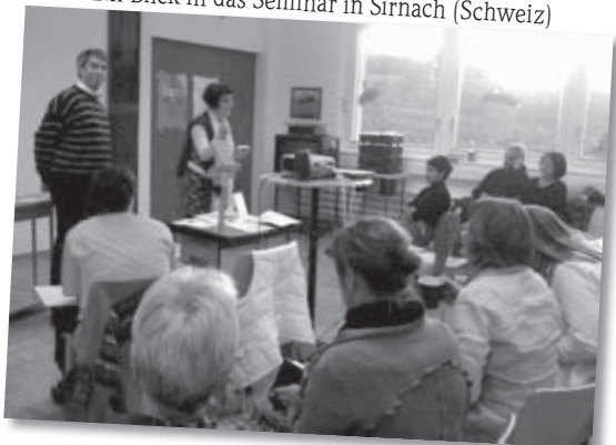
Ein Blick in das Seminar in Sirnach (Schweiz)

P.S. Der nächste AD(H)S-Trainerkurs beginnt am 24.-25. Februar 2012 in Gummersbach.